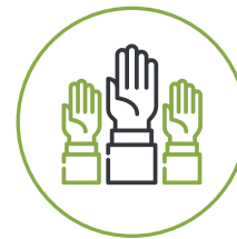
UITOEFENING VAN Stemrechten