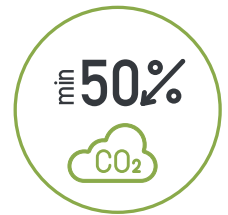
Koolstofintensiteit -73,36% VS. T.O.V. INITIEEL UNIVERSUM**