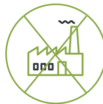
UITSLUITING VAN Ondernemingen