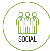
SOCIALE KWALITEIT +9,92% VS. T.O.V. INITIEEL UNIVERSUM**